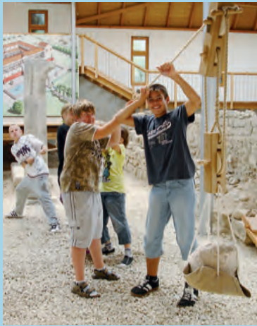
Museum für Jung und Alt

seiner Frau Julia Domna und Münzen des Gegenkaisers Magnentius (350–353) wie auch Terra Sigillata-Funde bezeugen, dass die Region zwischen Dinkelberg und Rhein vom 1. bis ins 4. Jahrhundert von römischer Kultur geprägt war.