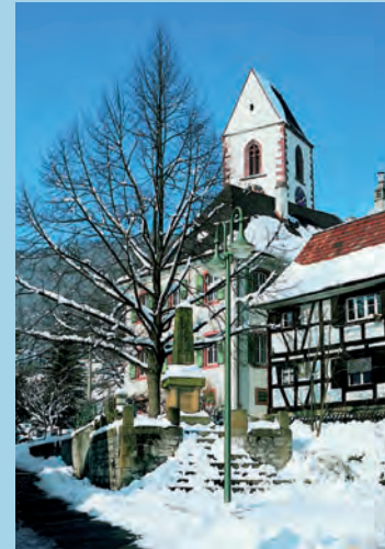
Historischer Ortskern Grenzach