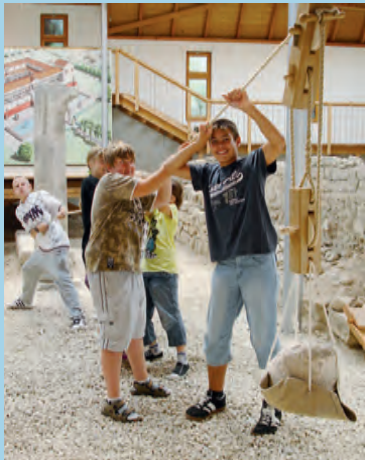
Museum für Jung und Alt

seiner Frau Julia Domna und Münzen des Gegenkaisers Magnentius (350–353) wie auch Terra Sigillata-Funde bezeugen, dass die Region zwischen Dinkelberg und Rhein vom 1. bis ins 4. Jahrhundert von römischer Kultur geprägt war.